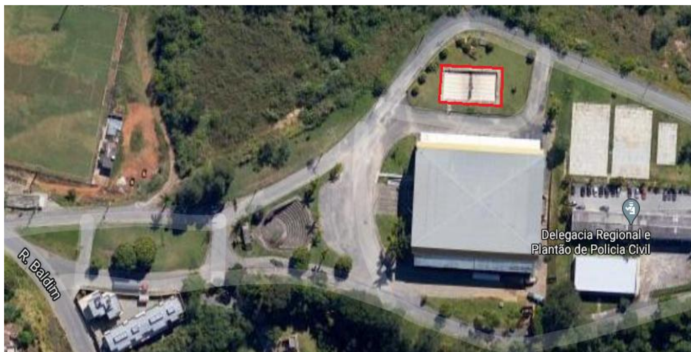
Figura 01 – Localização do terreno e área de intervenção

A contratada deverá realizar visita no local para verificar as necessidades e as demandas deste memorial.